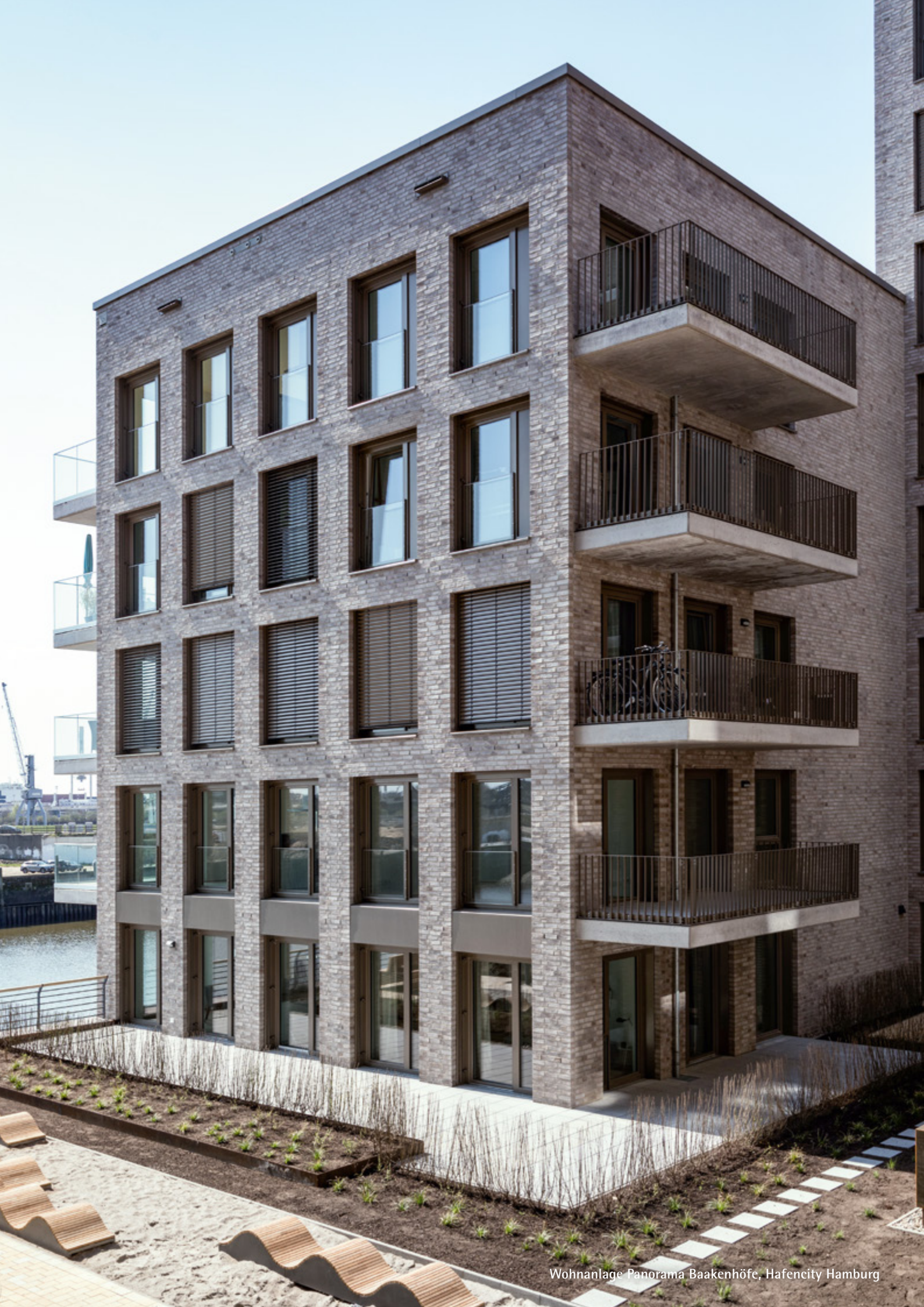
Wohnanlage Panorama Baakenhöfe, Hafencity Hamburg